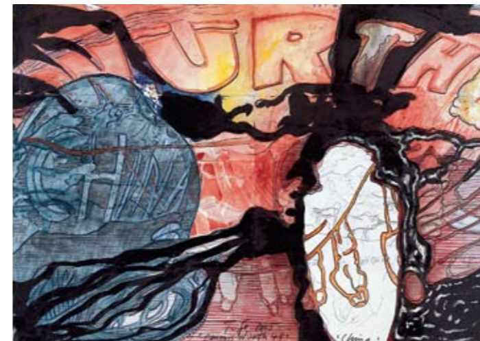
Thomas Lange Vision 49, 2005

Mengtechniek op papier - Technique de mélange sur papier, 42 x 59 cm - Inv. 9926