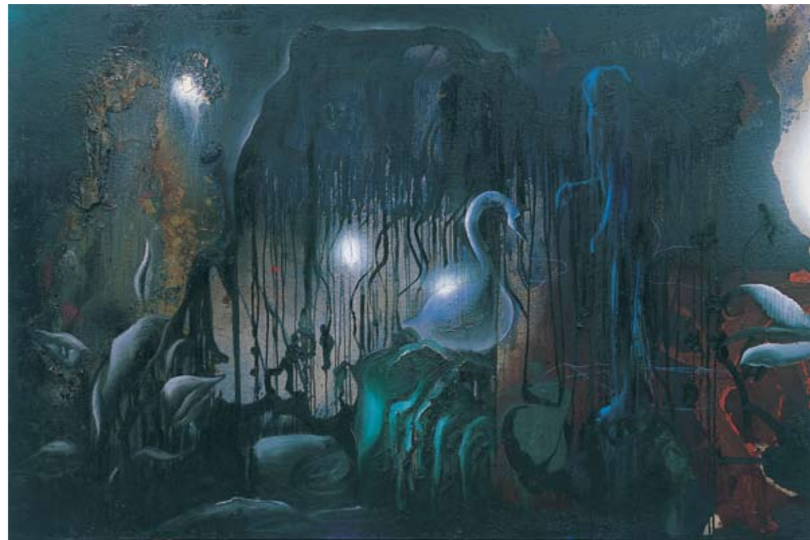
200 x 300 cm - Inv. 2890

Begin jaren negentig koopt Thomas Lange een oude hoeve in Italië waar hij zich deeltijds vestigt. De hoeve ligt op de grens van Latium, Umbrië en Toscane en heeft een groot atelier. Zijn 'verhuis' naar Italië valt onmiddellijk op in de ontwikkeling van zijn werken. Naast inhoudelijke veranderingen - hij neemt dingen op van de Italiaanse Renaissance - zet hij zijn schilderijen om in sculpturen, hiertoe aangezet door de archeologische sporen van de Etrusken en de oude keramiek. Hij maakt gebruik van de terracotta die hij daar ter plaatse vindt en laat deze bakken in de plaatselijke keramiek- en terracottabakkerijen. Zij worden bewerkt met een mengeling van as en zand en vertonen verfstrepen en brandsporen. De sculpturen lijken op archeologische vondsten en roepen associaties op met