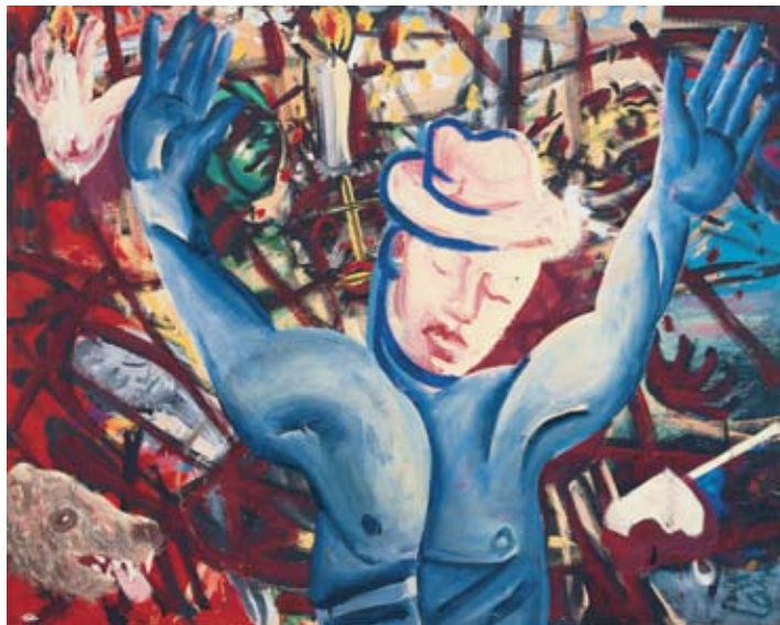
Mengtechniek op doek - Technique de mélange sur toile, 120 x 150 cm - Inv. 8011