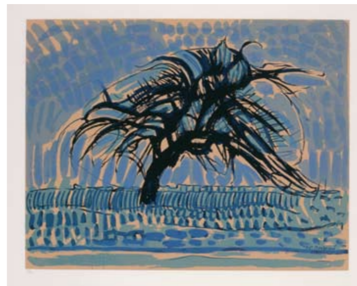
Piet Mondriaan Zeefdruk naar / sérigraphie d'après "l'arbre bleu, aquarelle, 1911", 1957 Inv. 4453

L'ambitieux projet d'un langage abstrait universel a marqué longtemps l'art du XX e siècle. En effet, l'abstraction a dominé le discours artistique depuis les années 1910 jusqu'aux années 1960. Seule la Première Guerre mondiale a interrompu cette prééminence. D'innombrables artistes ont considéré la représentation sans objet comme la seule expression possible de l'époque moderne. Sous prétexte que la photographie avait repris la représentation du réel, ils se sont penchés sur des phénomènes naturels comme la lumière et le mouvement. Ainsi, ils ont pu montrer leurs visions intérieures sans aucune référence naturelle. Dès lors, il n'y avait plus qu'un pas à franchir jusqu'à la dissolution des formes et l'indépendance des couleurs. La majorité des artistes ont accompli ce cheminement étape par étape; ils se sont déta- chés très progressivement du monde visible pour