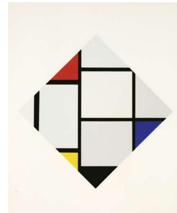
Titelpagina Piet Mondriaan Zeefdruk naar / sérigraphie d'après "composition dans le carreau avec rouge, jaune et bleu, 1926", 1957 Inv. 4453