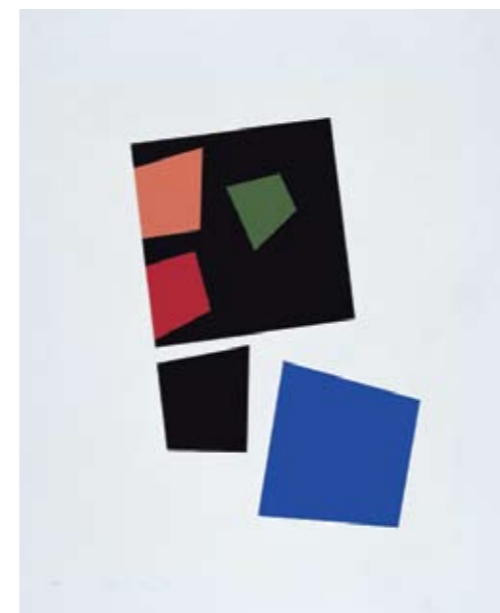
Hans (Jean) Arp Zeefdruk naar / Sérigraphie d'après "Construction: selon les lois du hasard, collage, 1918", 1959 Inv. 4450

L'exposition présente exclusivement des œuvres de la collection Würth. C'est cette exclusivité qui inscrit les artistes choisis et exposés dans un cadre. Il ne s'agit donc pas d'une rétrospective habituelle de l'art abstrait mais plutôt d'une exposi- tion qui privilégie quelques artistes et montre ainsi différents aspects de l'abstraction.