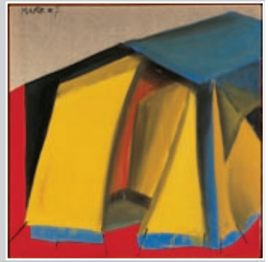
Markus Lüpertz, Zeit I - dithyrambisch, 1965, Leimfarbe auf Leinwand, 152 x 154 cm, Inv. 3435