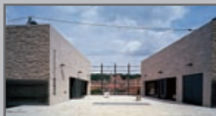
Andi Schmid / Sammlung Würth