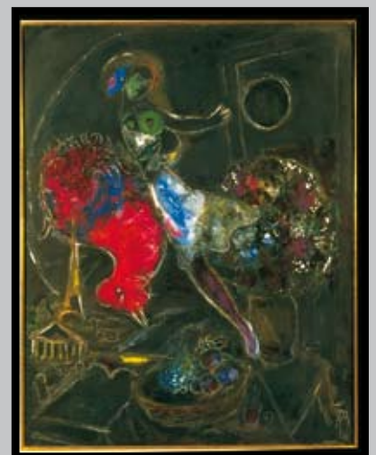
Marc Chagall La Nuit 1953 Olieverf op linnen / Peinture à l'huile sur lin 145 x 114 cm Inv. 4895