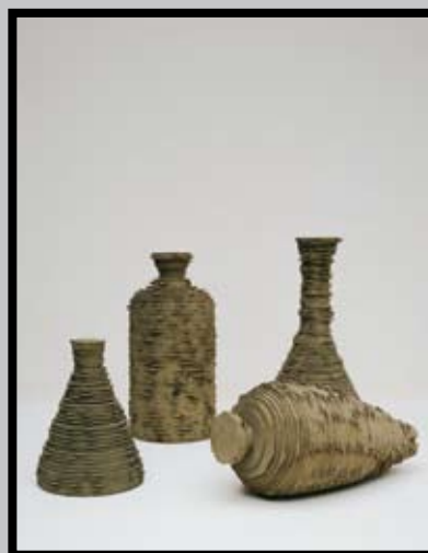
Tony Cragg Ohne Titel – Flaschen 1995 Zandsteen, gedraaid, vierdelig, diverse afmetingen Pierre de sable, tournée, 4 pièces, différentes tailles Inv. 3852

Benieuwd hoe moderne kunstenaars het thema stillevan interpreteren en verwerken in hun kunst? 'De Stille Dialoog' loopt van 7 oktober tot 10 februari .