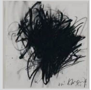
Arnulf Rainer, Straub, 1975, oliepastel op papier, 29 x 28 cm, inv. 2641